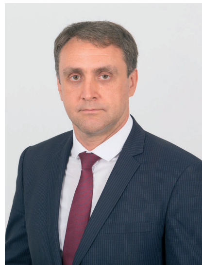
Александр ЩЕРБА, Председатель Верховного Совета

готовленный к такого рода презентациям на нашем государственном телеканале фильм. Здесь же прошел международный круглый стол «Экономическое и культурно-гуманитарное сотрудничество России и Приднестровья: новые перспективы и возможности». В числе участников дискуссии – представители российской общественности, депутаты Государственной Думы, а также депутаты Верховного Совета, члены Правительства и общественных организаций нашей республики. Главная тема совместной встречи – меры поддержки российских соотечественников, проживающих в Приднестровье.