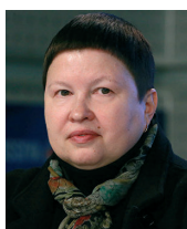
Елена СУТОРМИНА, член Общественной палаты РФ

Сегодня Приднестровье не мыслит себя вне Русского мира. Мы находимся на рубежах большой России, далеко от Москвы, но сердцем и душой мы вместе с вами, россияне, соотечественники.