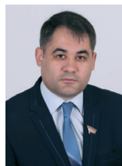
Вадим ДОНИ, депутат Верховного Совета

С почетной миссией представления в мире нашей республики члены приднестровской делегации справились более чем успешно. Мир узнал, что среди 188 стран, которые приехали в Сочи, есть еще одна – Приднестровская Молдавская Республика. Пусть непризнанная, но состоявшаяся.