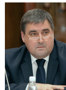
Алексей СИЛАНОВ, депутат Госдумы

Необходим системный подход в реализации социально-гуманитарных проектов. При взаимодействии с различными органами власти мы реализовали несколько проектов на территории Приднестровья. С Минздравом – в части переподготовки медицинских работников, с Министерством образования – ряд проектов в сфере молодежной политики. Но это, в основном, отдельные проекты. Как таковой системной поддержки соотечественников, проживающих в Приднестровской Молдавской Республике, до сих пор нет. При этом жители Приднестровья связывают свое будущее с Россией, надежды возлагали и возлагают на руководство России. Те вопросы, которые они поднимают, мы обязаны решить.