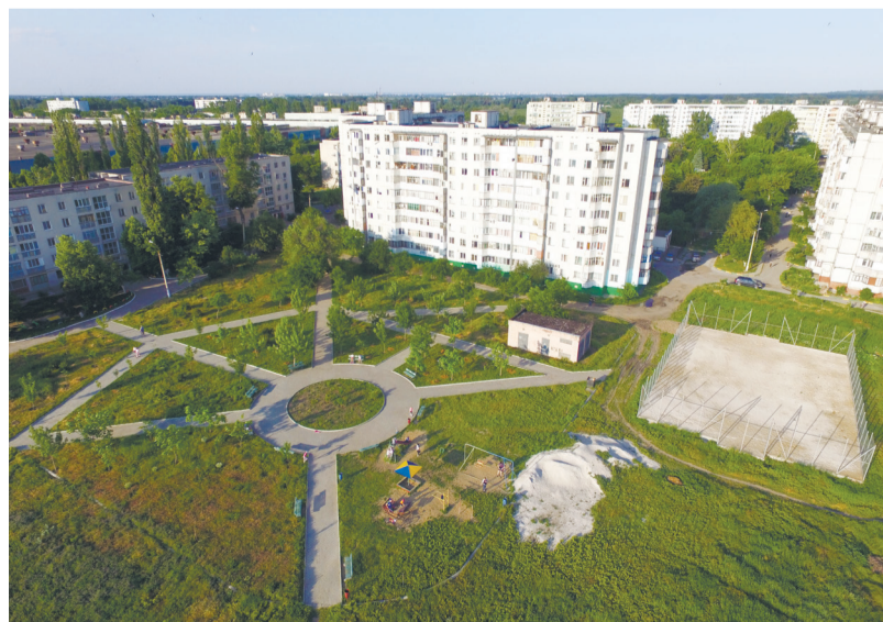
Здесь обустраивают новое место досуга для жителей одного из микрорайонов Бендер.