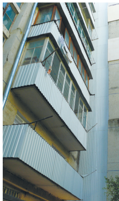
Облицовка профнастилом переходных лоджий (ул. К. Либкнехта, 76)

Как сообщил депутат, в настоящее время заключаются договоры, они проходят согласование, главное, что средства будут израсходованы в этом году. «Есть порядок расчетов, проверок. Это достаточно длительно и, к сожалению, немного бюрократизировано. Надеюсь, что в этом году результаты будут достигнуты быстрее, чем в прошлом. Но это не зависит от нас. Это рутинная работа, связанная с Министерством экономического развития, финансовыми управлениями, отделом строительства, управлением городского хозяйства. У них – свои обязанности, им нужно все перепроверить. Это народные день-