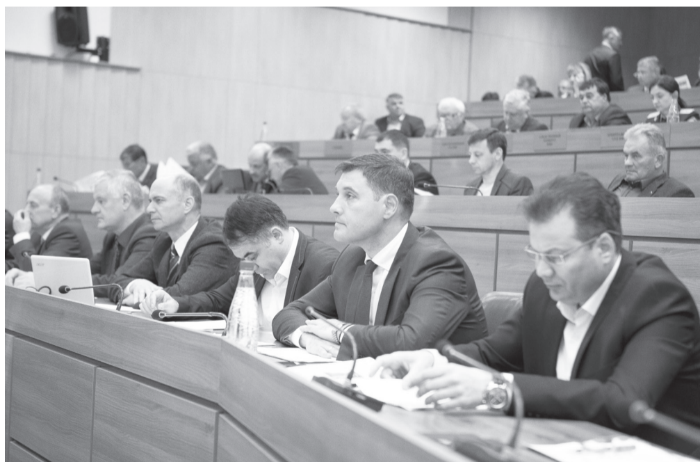
Виктор ГУЗУН, депутат Верховного Совета

Общий объем финансирования госпрограммы – 3,6 млн руб. На этот год из государственной казны на развитие предпринимательства планируется выделить 1,1 млн руб. Это средства специального фонда развития предпринимательства, параметры которого были утверждены парламентом законом о республиканском бюджете на 2019 г. Таким образом, сфера предпринимательства получит поддержку государства на долгосрочной и системной основе.